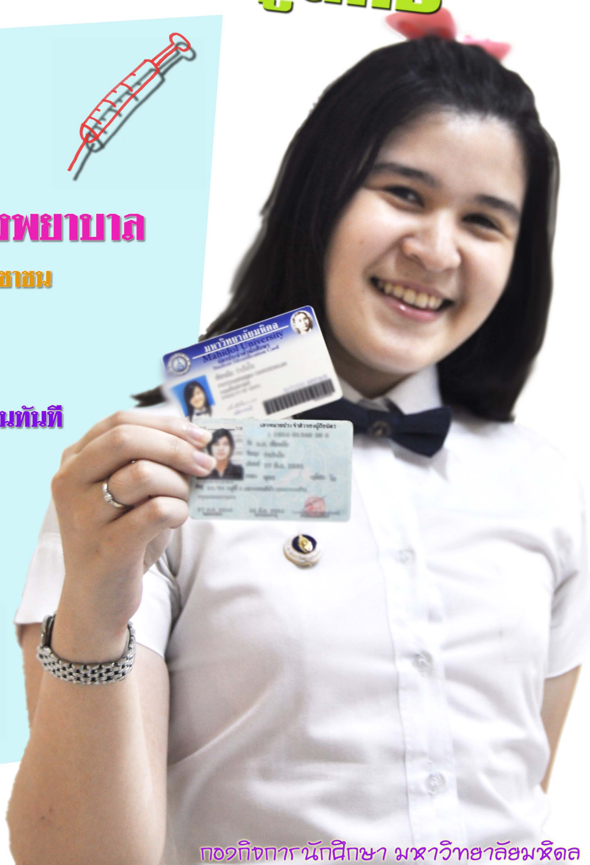
กองกิจการนักศึกษา มหาวิทยาลัยมหิดล

*การใช้ 2 ใบครบวงจร กรณีเข้ารับบริการโรงพยาบาลของมหาวิทยาลัย ซึ่งนักศึกษา ต้องจัดทำสิทธิการรักษาส่วนบุคคล ได้แก่ ประกันสุขภาพถ้วนหน้า กรมบัญชีกลาง รัฐวิสาหกิจ ประกันสังคม ซึ่งวิธีการจัดทำแต่ละสิทธิสามารถศึกษารายละเอียดได้ตามที่อยู่ด้านล่าง หรือโทรสอบถามที่ 02-441-9733 ในวันและเวลาราชการ